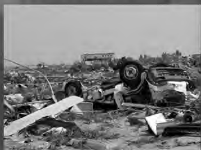
高知を 地震から守る