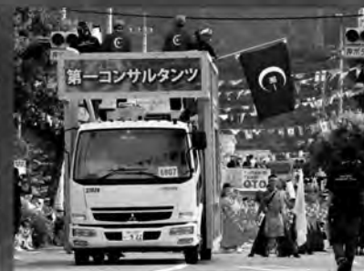
高知の コミュニティを守る