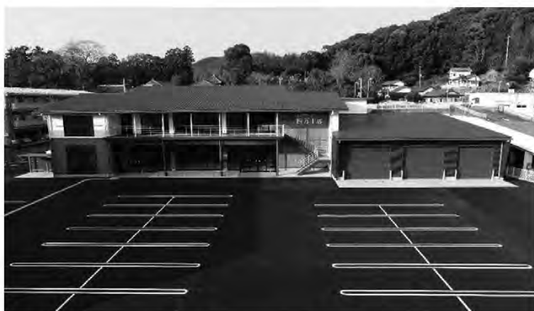
JA高知県JAグリーン四万十店新築工事