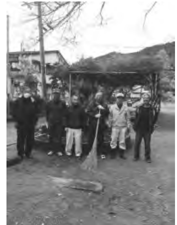
公園の清掃と花壇の植栽作業

を掲げていますが、コロナ感染予防によりほとんど実現できていませんので、来年も引き続き実施して参ります。