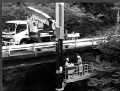
高知の インフラを守る